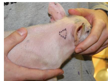
Imagen 1. Zona adecuada para inyección intramuscular de un cerdo.